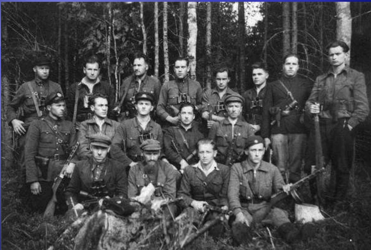
Kunigaikščio Margio rinktinės Ažuolo apsaugos būrio partizanai.