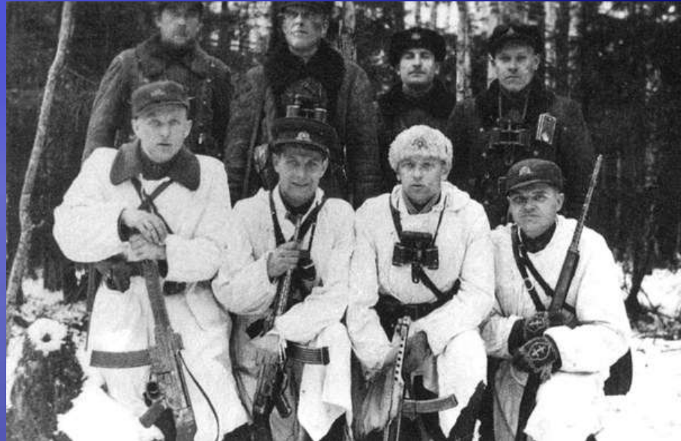
Pietų Lietuvos srities partizanų vadovybė pakeliui į Žemaitiją.