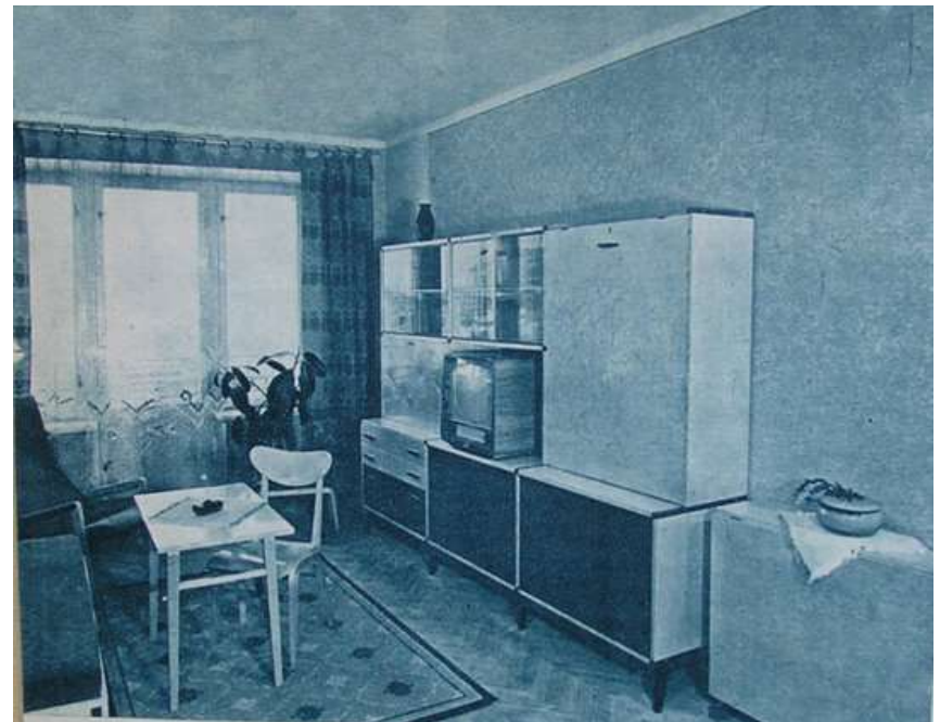
Sovietinė gyvenamoji erdvė