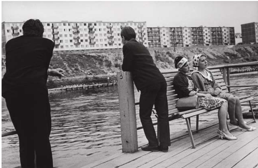
Keltas antaklnis žirmūnai (1964 m.)