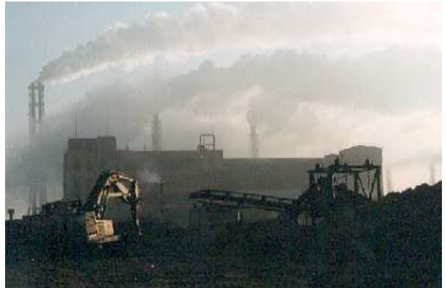
Kėdainių chemijos gamykla