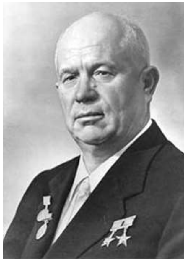
Nikita Chruščiovas (1894-1971)