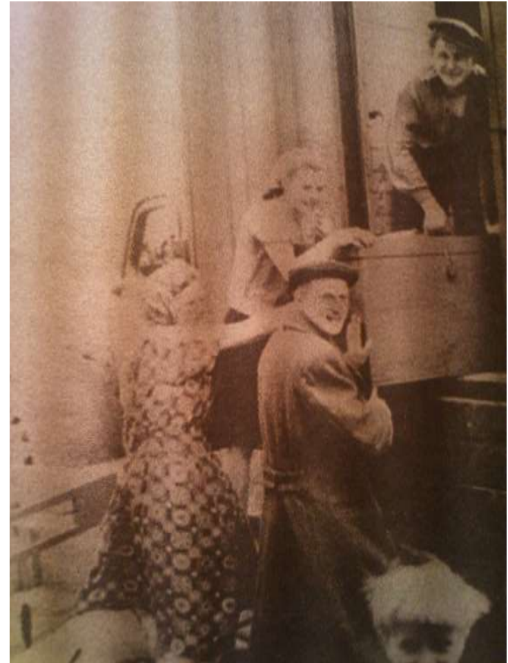
Sibiro tremtiniai grįžta į Lietuvą