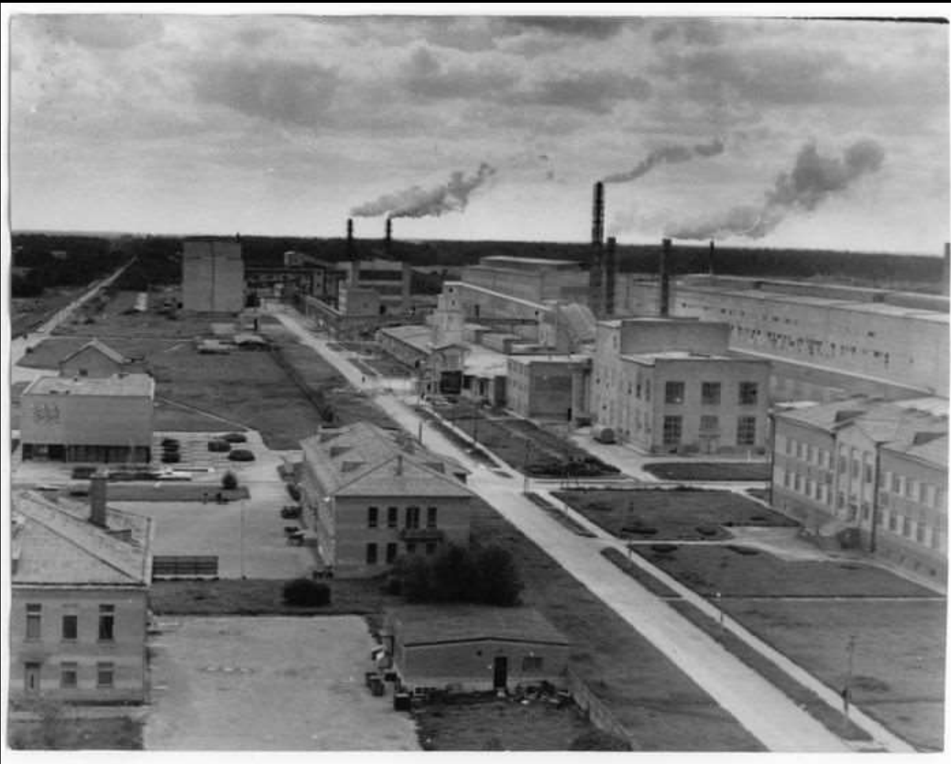
1963 m. sieros rūgštį pradėjo gaminti Kėdainių chemijos gamykla.