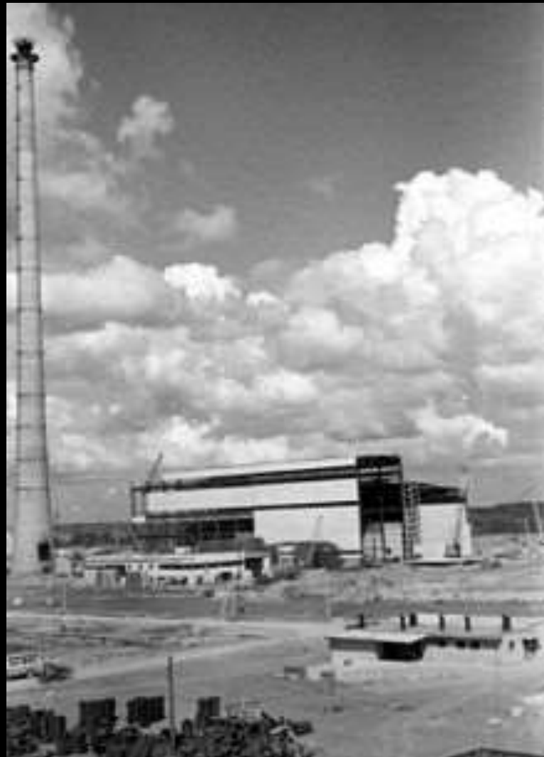
1980 m. paleista Mažeikių naftos perdirbimo įmonė