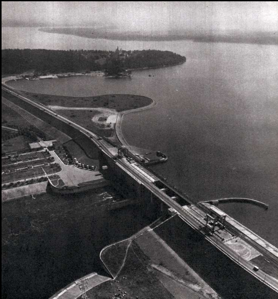
1965 m. įsikūrė Kauno dirbtinio pluošto gamykla, moderniausia chemijos pramonės įmonė. Tai buvo viena didžiausių gamyklų Sovietų Sąjungoje ir Europoje.