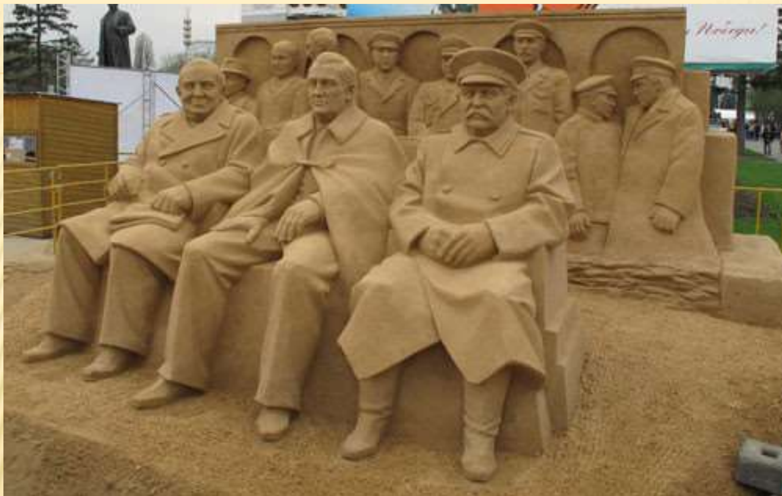
Smēlio figūru paroda Rusijoje