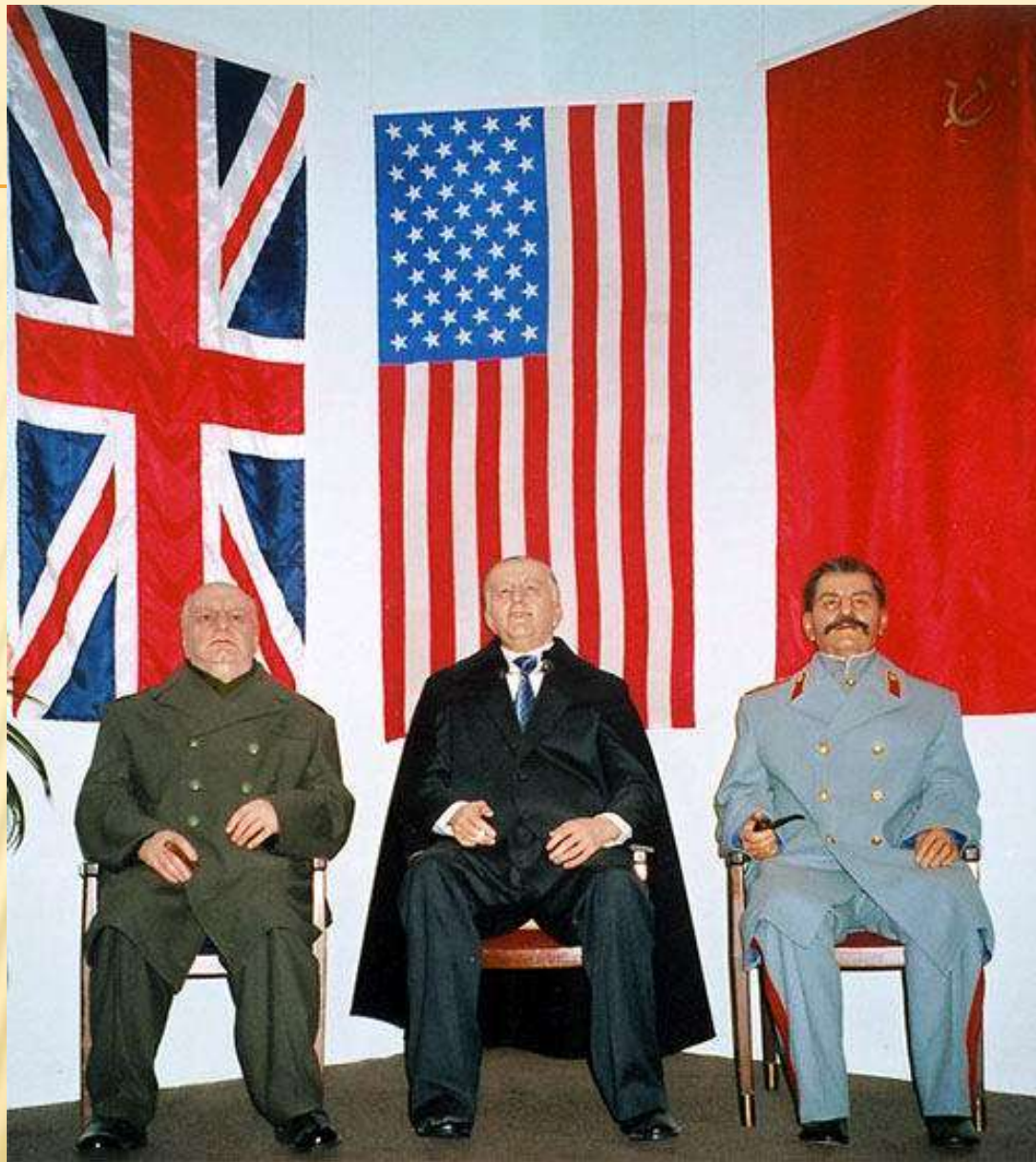
Vaškinēs figūros: Didysis Krymo konferencijas trejetas