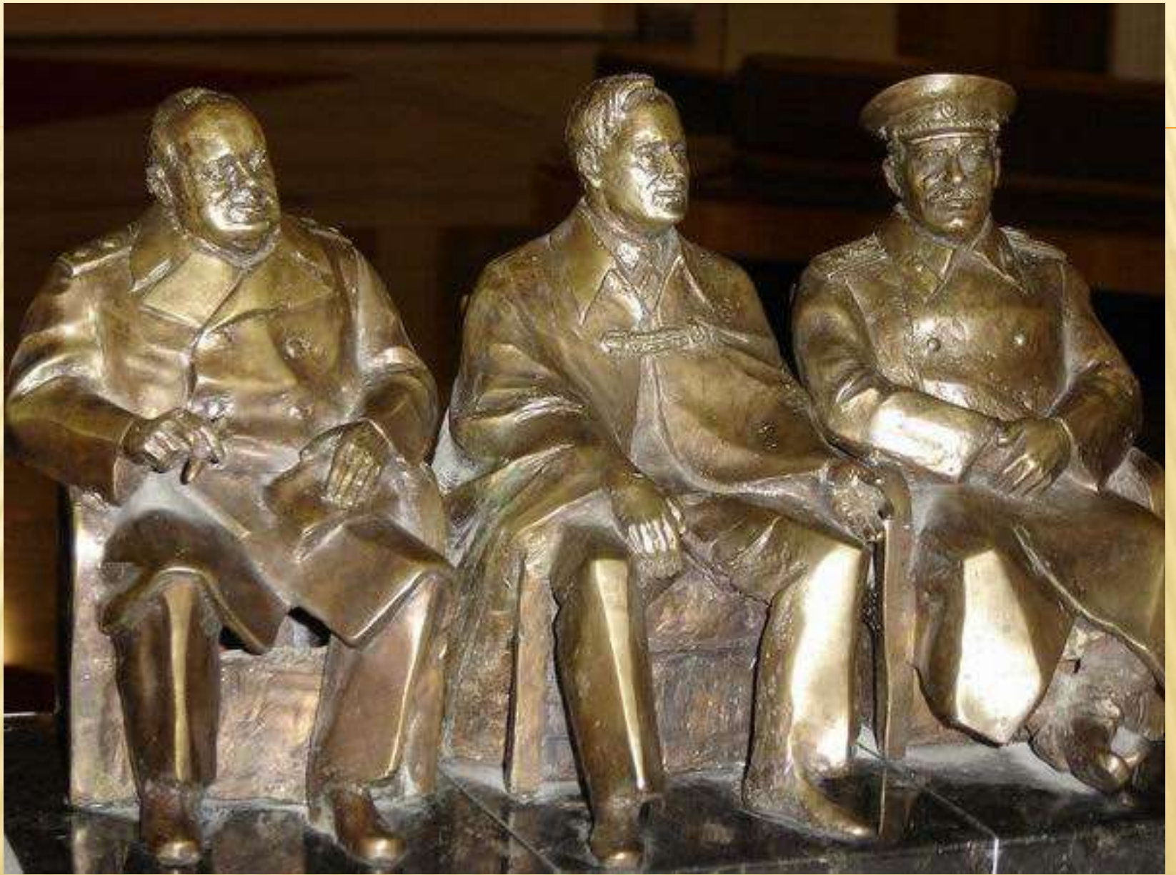
Skulptūra Rusijos muziejuje