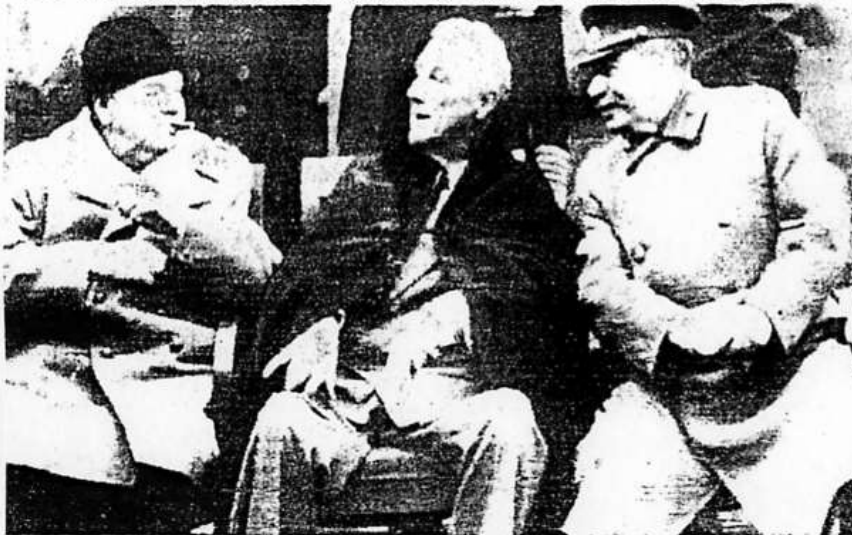
Prime Minister Churchill, President Roosevelt and Marshal Stalin on the grounds of Livadia Palace