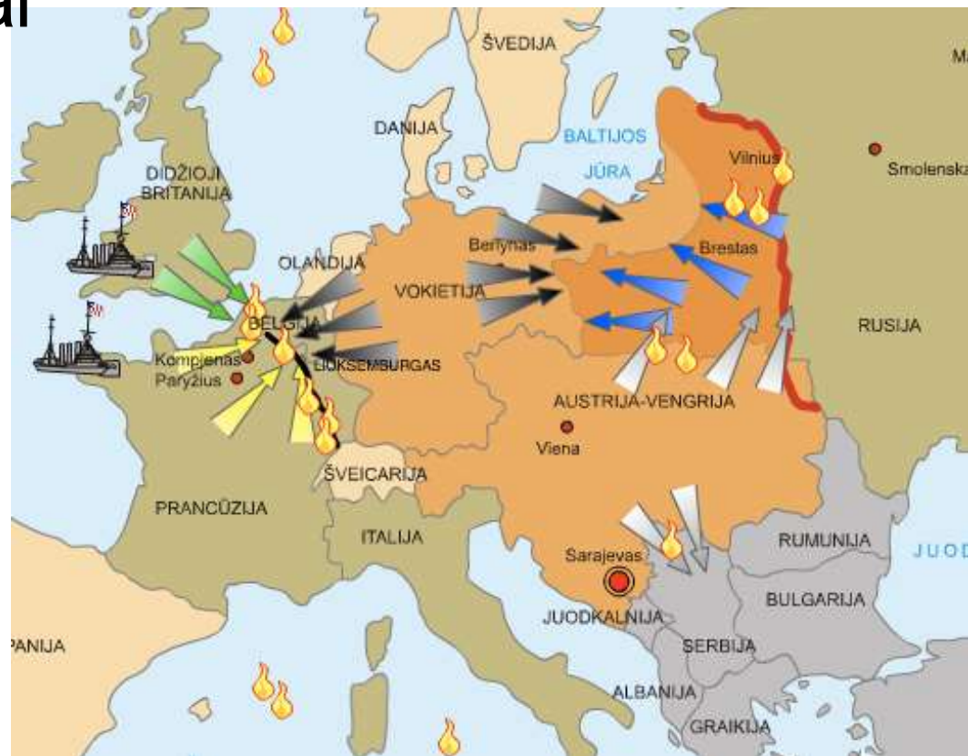
Europos žemėlapis iliustruojantis situaciją žemyne 1915 m.