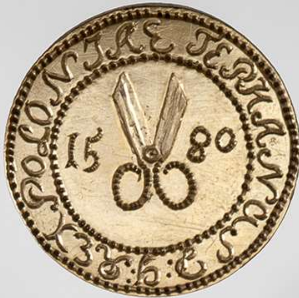
Siuvėjų cecho antspaudas. Lietuva, XVI a.