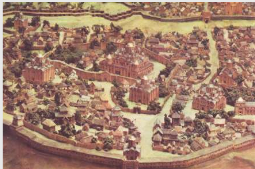
Miesto modelis X - XIII a.