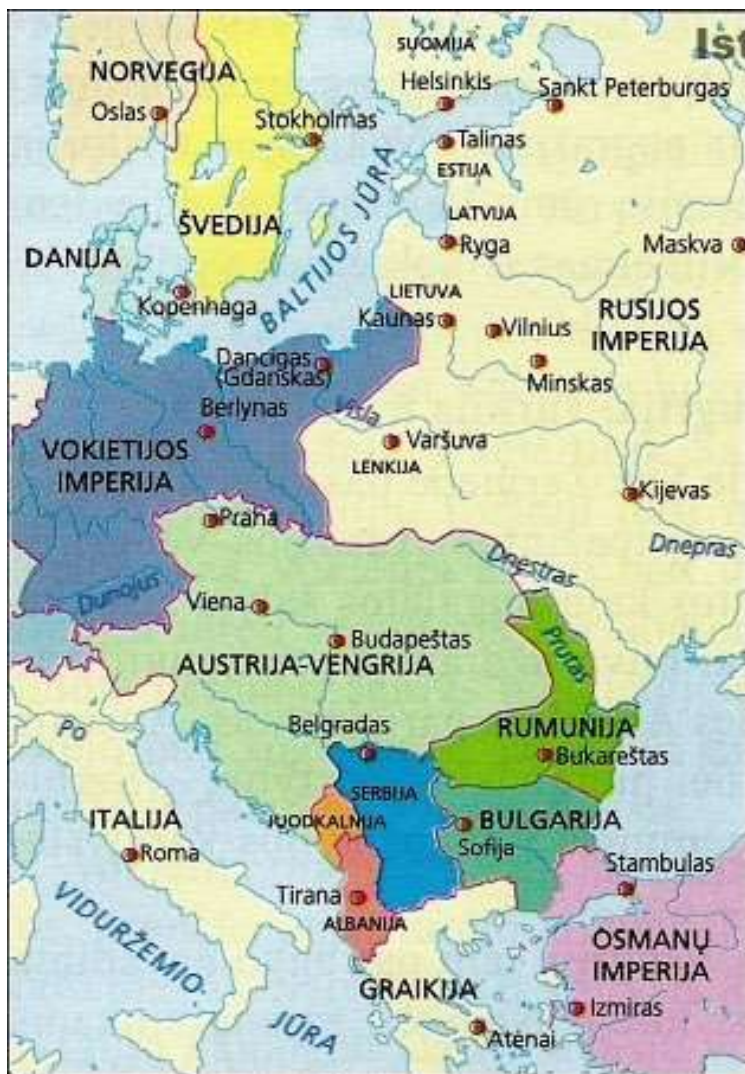
Europos šalys iki Pirmojo pasaulinio karo