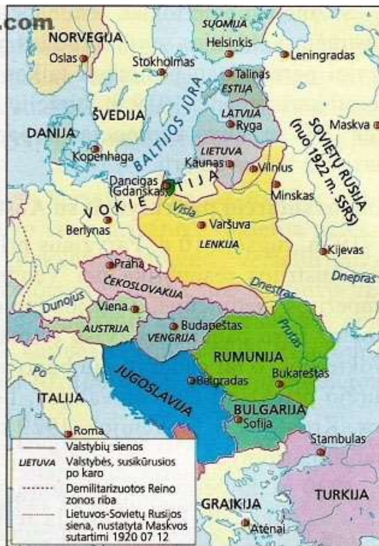
1918–1920 m. susikūrusios naujos Vidurio ir Rytų Europos valstybės