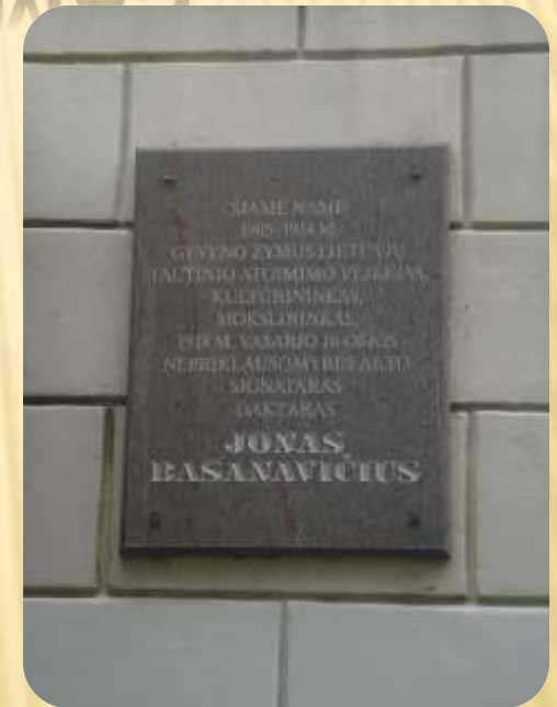
Paminklinė lenta Jonui Basanavičiui Vilniuje, Bokšto gatvėje