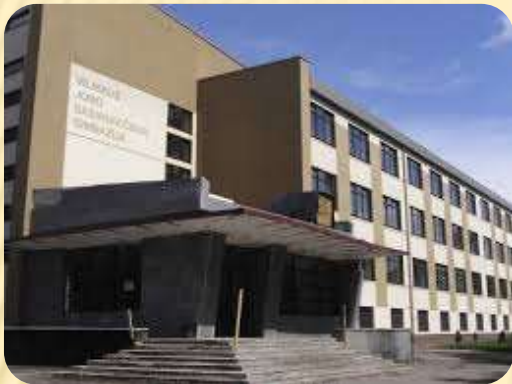
Vilniaus Jono Basanavičiaus gimnazija