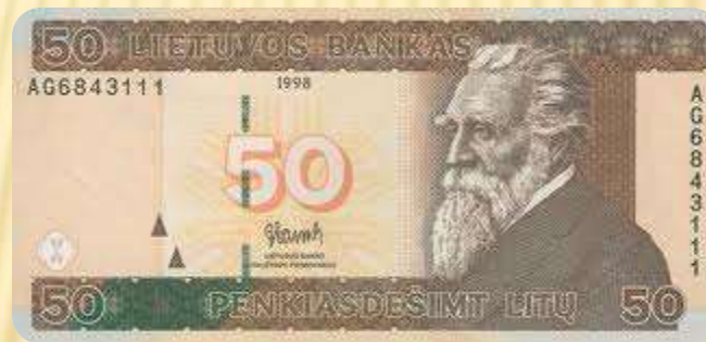
J. Basanavičius pavaizduotas ant 50 litų kupiūros