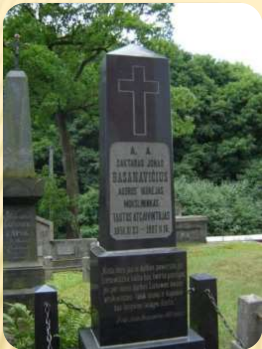
J. Basanavičiaus kapas Rasų kapinėse