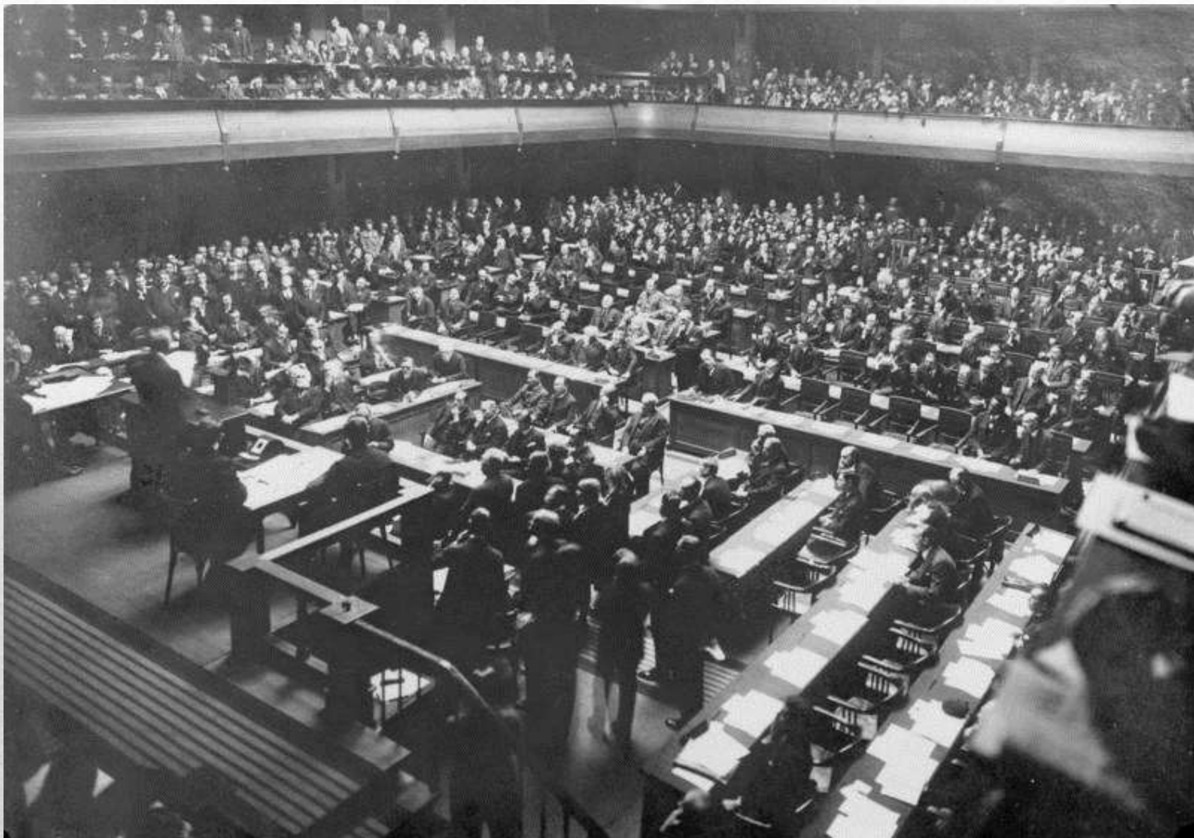
(Tautų Sąjungos Tarybos posėdis 1926m. kovą, Ženevoje)