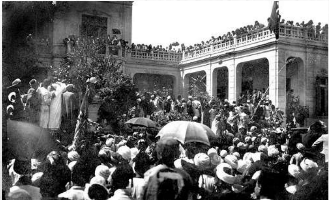
(Egiptas 1919m. Egiptiečiai reikalauja nepriklausomybės)