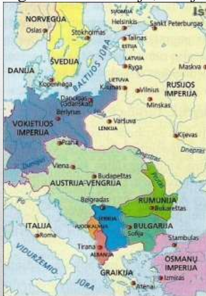
Europos šalys iki Pirmojo pasaulinio karo

Vidurio Europoje vyravo atgimusi Lenkijos valstybė, o Baltijos jūros pakrantėje – savo nepriklausomybę atgavusios Suomija, Estija, Latvija ir Lietuva.