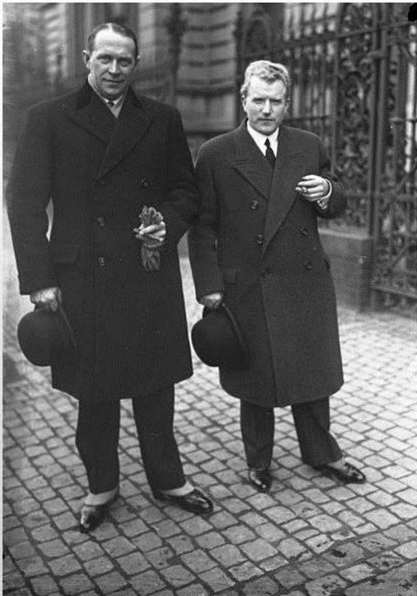
1. Februar 1932