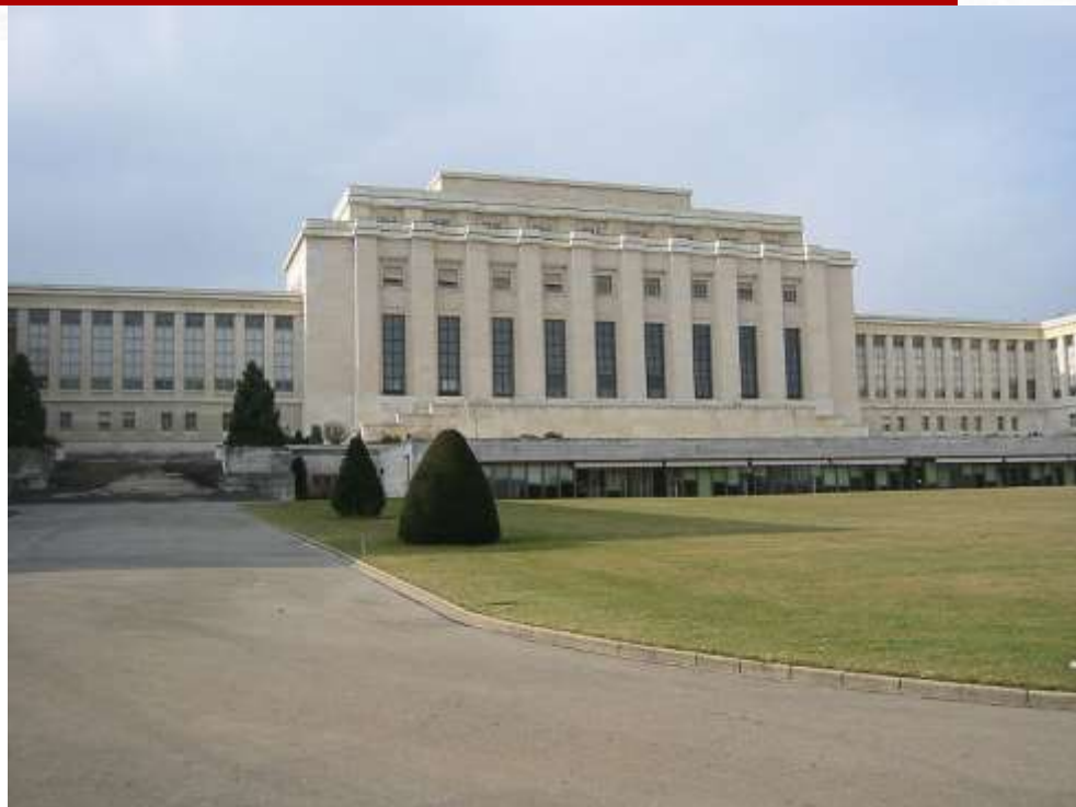
(Tautų rūmai - pastatas, pastatytas 1929-1938 m. ir buvęs Tautų Sąjungos būstine iki jos paleidimo)