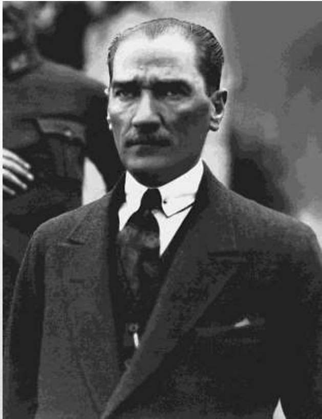
(Mustafa Kemal Atatürk – pirmasis nepriklausomos Turkijos prezidentas)