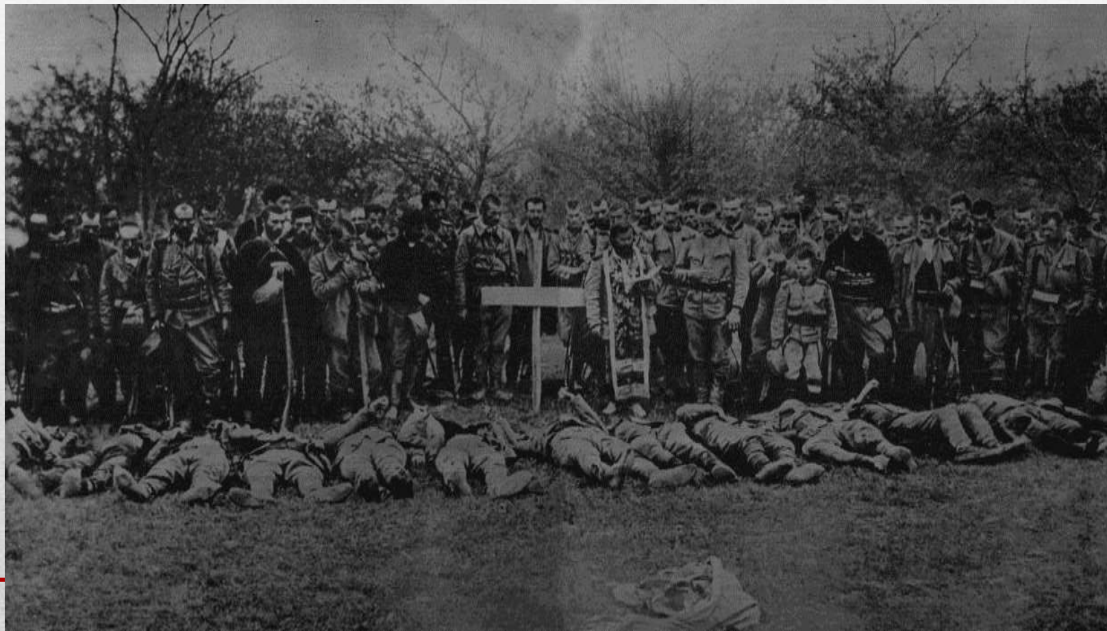
(Serbų kariai prie mirusių draugų)

Pirmasis pasaulinis karas baigėsi 1918 metais lapkričio 11 dieną , kai tarp Vokietijos ir jos priešininkų Kompjeno miške, netoli Paryžiaus, buvo pasirašytos paliaubos. Rusija iš karo išstojo 1918m. kovo 3d.