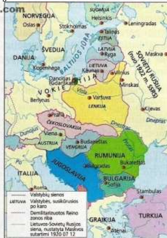
1918–1920 m. susikūrusios naujos Vidurio ir Rytų Europos valstybės