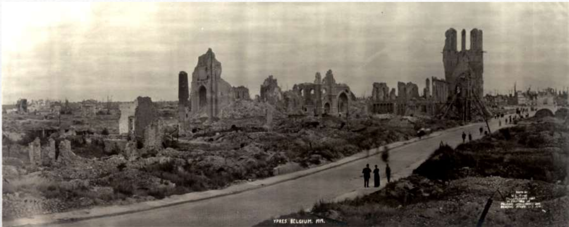
(Ypres miestas Belgijoje, 1919m. Jis buvo visiškai sugriautas po IPK)