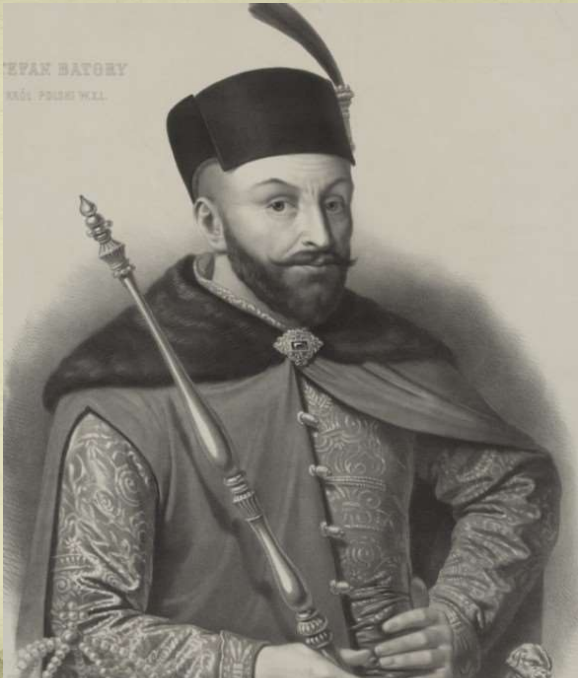
STEFAN BATORY KING OF POLISH