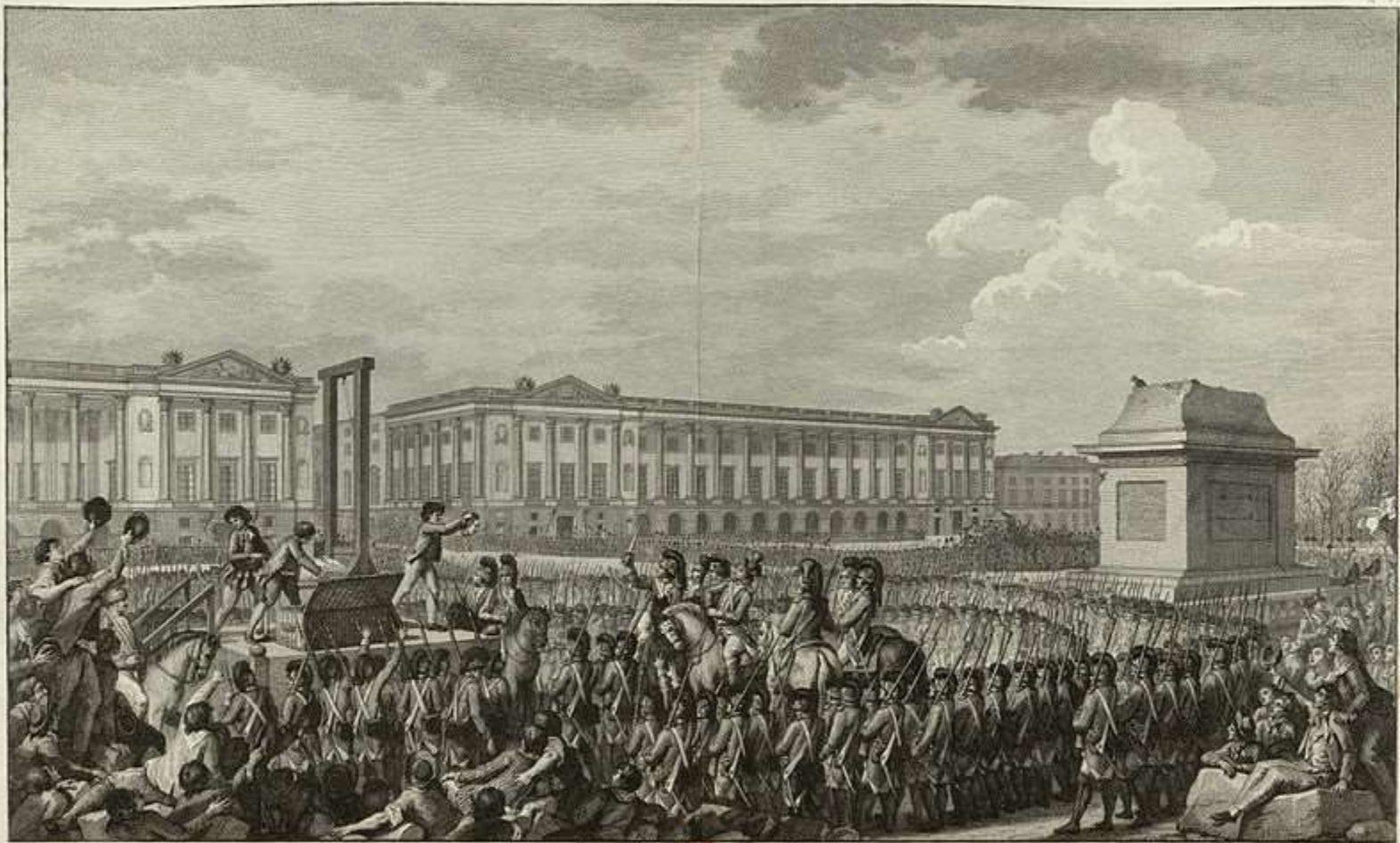
Journée du 21 Janvier 1793 la mort de Louis Capet sur la Place de la Révolution Présentée à la Convention Nationale le 30 Germinal par Helman Paris chez l'Auteur, Rue Honore' St. 1437 près des Jacobins.