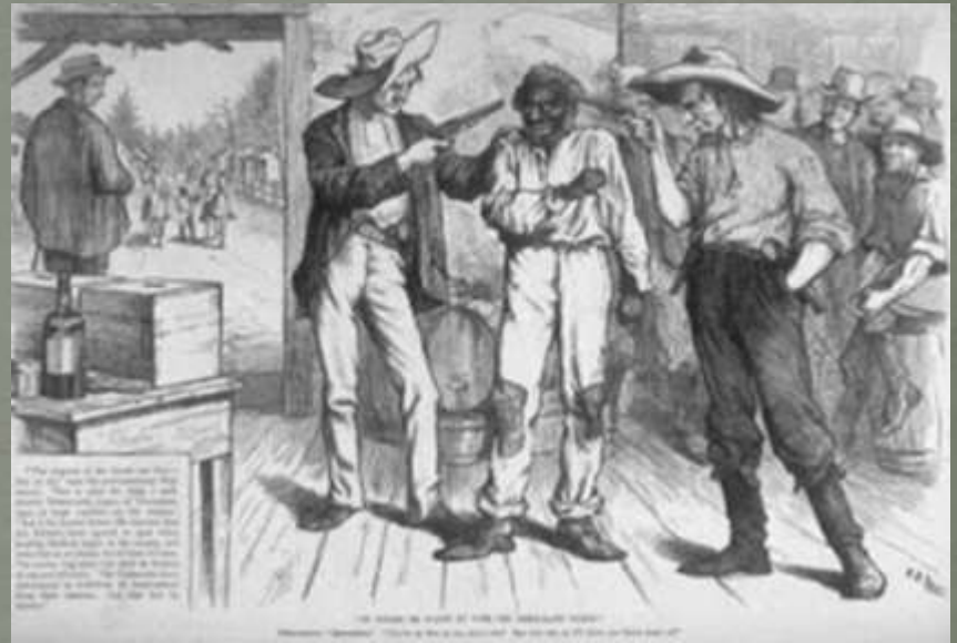
Vaizduojamas žmonių žudymas

Klano žiaurumu norėta suvaldyti juodaodžių balsavimą. Daugiau nei 2000 žmonių buvo išžudyta, sužalota likus vos kelioms savaitėms iki 1868 m. lapkričio mėn. prezidento rinkimų.