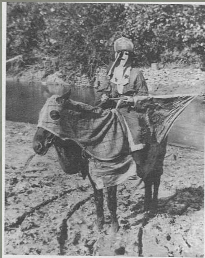
Klano narys ant žirgo 1868 m.

Nors Kuklusklano veikla iš pradžių buvo įvardinta kaip išdaigiška, vėliau ši veikla buvo nukreipta prieš Respublikos atkūrimo vyriausybę ir jų lyderius. Nariai žiauriai kovojo prieš negrų lygiateisiškumą visuomenėje.