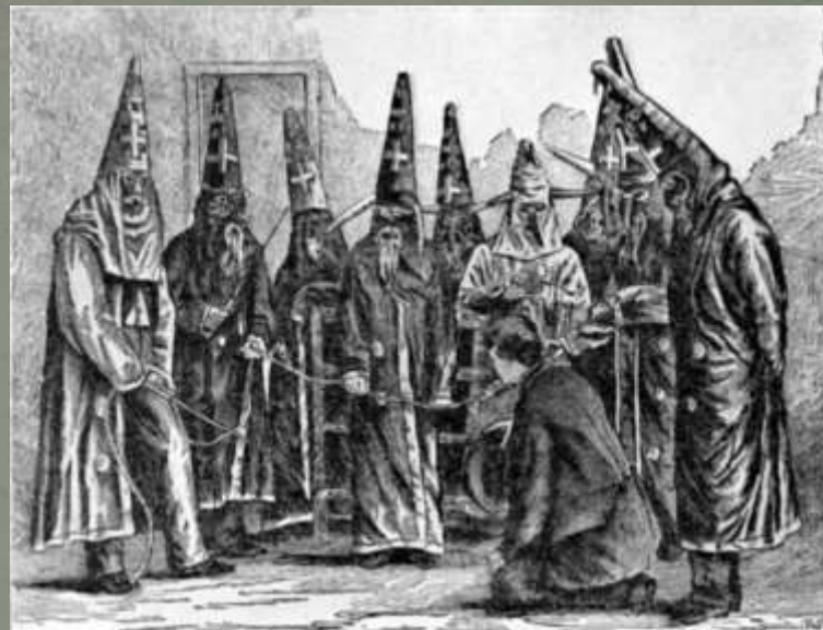
Kuklusklano narių kostiumai Šiaurinėje Karolinoje 1870 m.

Dauguma klano narių veikdavo mažuose miestuose ir kaimo apylinkėse, kur žmonės pažindavo vieni kitus. Kartais pavykdavo atpažinti ir užpuolikus.