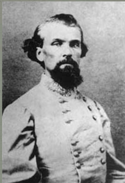
Nathan Bedford Forrest

Kuklusklanas greitai išsiskirtė beveik į kiekvieną pietinę valstiją.