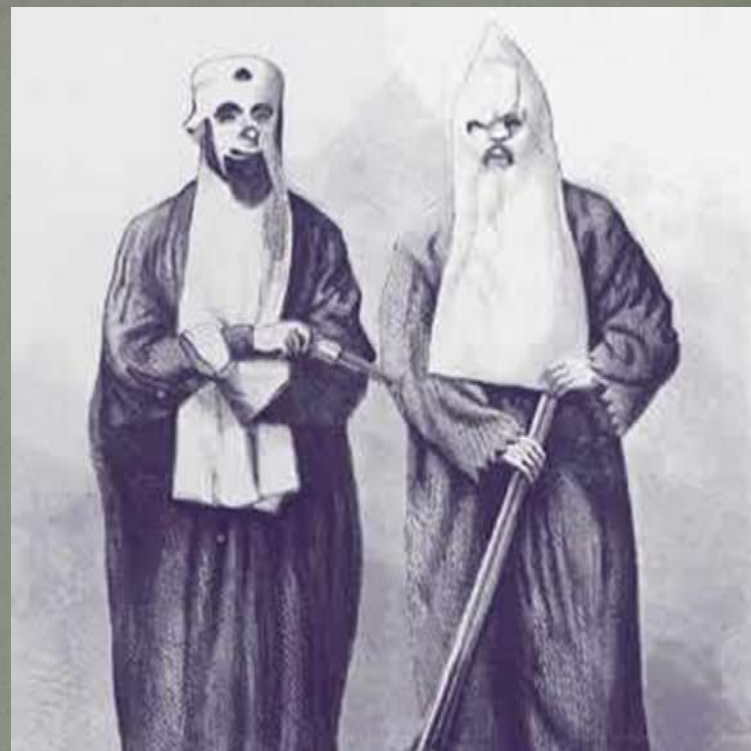
Kuklukslano nariai Tenesyje 1866 m.

Kuklusklano nariai siekė teroristiniais išpuoliais neleisti, kad juodaodžių teisės būtų sulygintos su baltųjų.