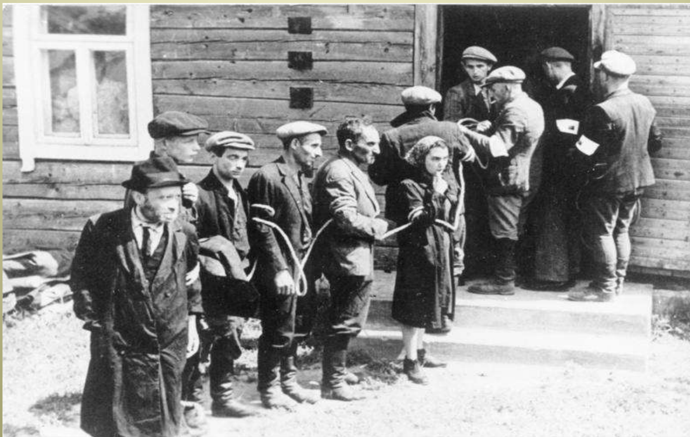
Bundesarchiv, Bild 183-B12290 Foto: o.Ang. | Juli 1941

Iš Vokietijos į Lietuvą atvyko specialios naikinimo grupės (Einsatzgruppen), kurios turėjo išžudyti komunistus, žydus, čigonus.