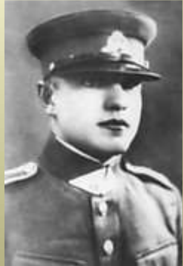
LLA įkūrėjas ir vadas

Lietuvos laisvės armija (LLA) – slapta lietuvių tautinė, karinė ir politinė organizacija, siekusi atgauti Lietuvos nepriklausomybę ne tik politinėmis, diplomatinėmis priemonėmis