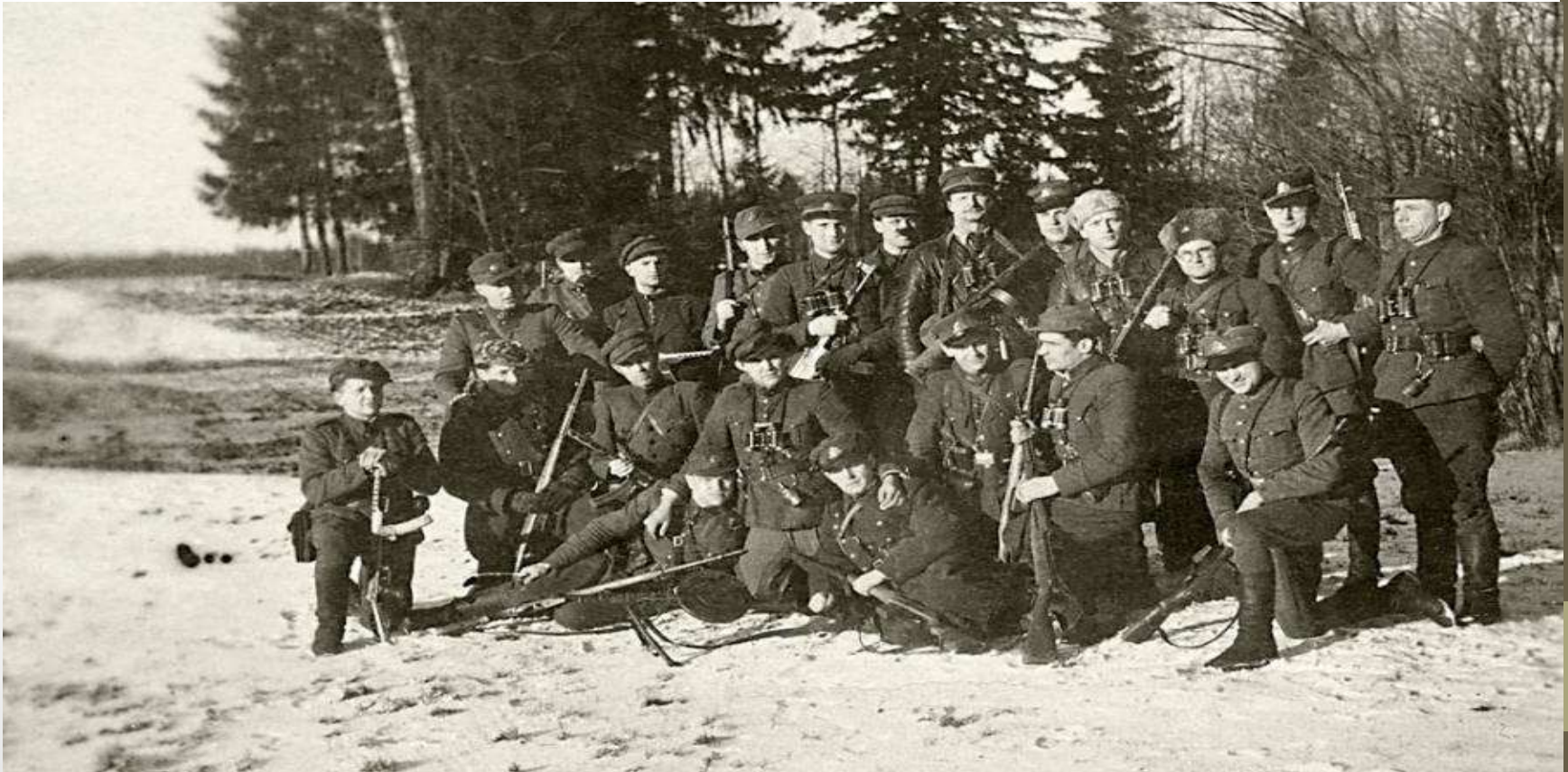
1949 m. vasario pradžia – prieš Lietuvos partizanų vadų suvažiavimą.

1949 m. vasario 2 – 22 d. buvo sušauktas Lietuvos partizanų vadų suvažiavimas, kuriame dalyvavo atstovai iš visos Lietuvos. Jau pirmame posėdyje buvo nutarta Lietuvos ginkluotojo pasipirešinimo organizaciją pavadinti Lietuvos laisvės kovos sąjūdžiu (LLKS) .