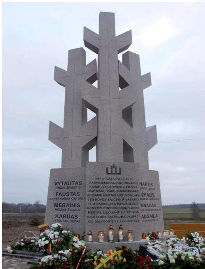
Paminklas partizanų vadams, 1949 m. vasario 16 d. pasirašiusiems LLKS deklaraciją.