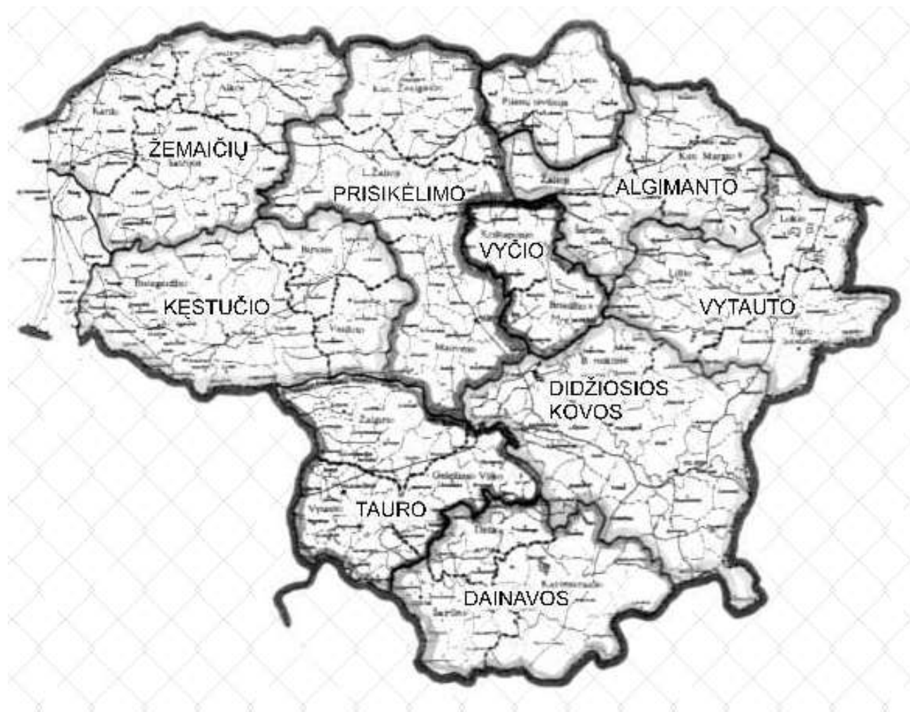
Lietuvos partizanų apygardų teritorijų 1949 m. žemėlapis.