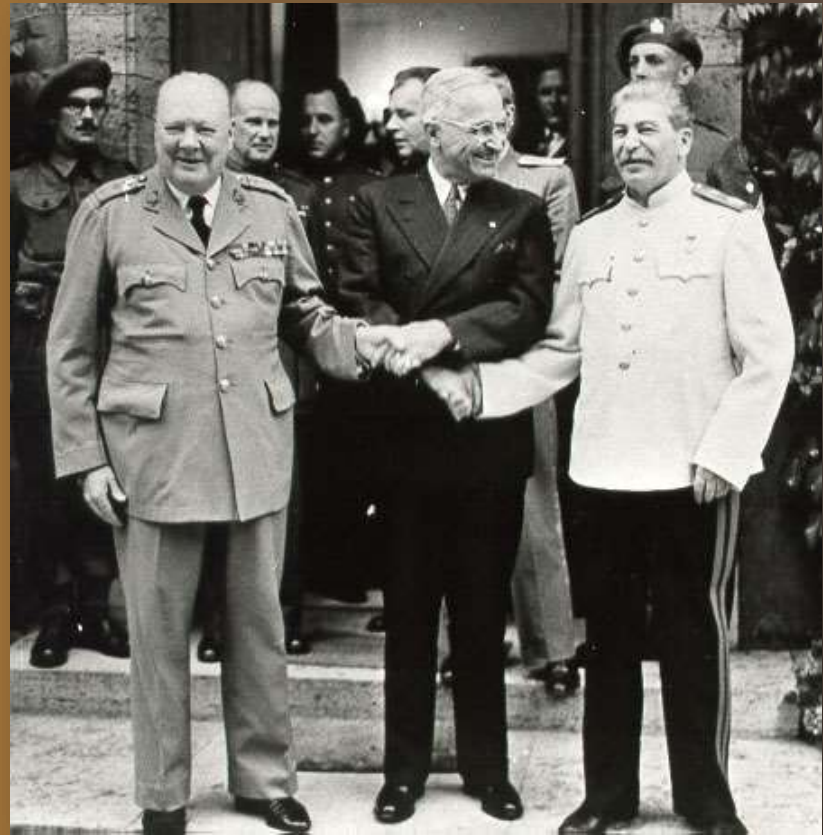
V.Čerčilis, F.Ruzveltas ir J.Stalinas

1945 m. pasibaigus karui Europoje, bet dar neprasidėjus karui prieš Japoniją, Potsdame susirinko didžiųjų valstybių vadovai ir iš esmės numatė pokario Europos ateitį.