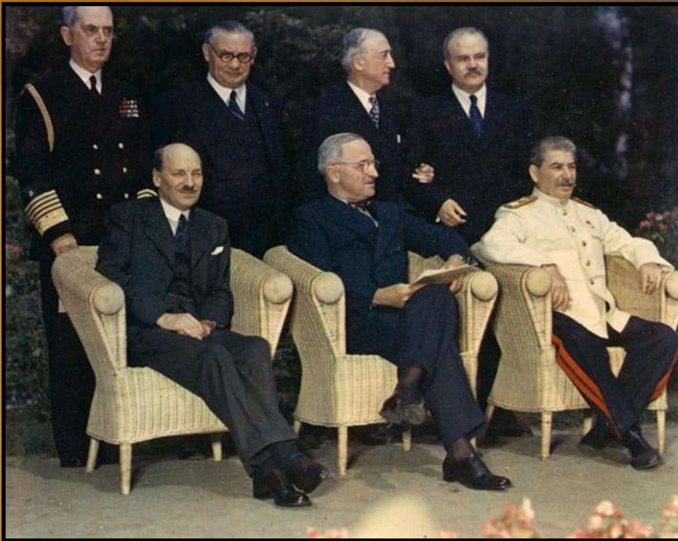
Potsdamo konferencijos dalyviai ir jų pagrindiniai patarėjai. Sėdi (iš kairės j dešinę): Klementas Etlas, Haris Trumenas, Stalinas. Stovi: admirolas Viljamas Lihis, Ernestas Bevinas, Džeimsas Byrnsas, Viačeslavas Molotovas.