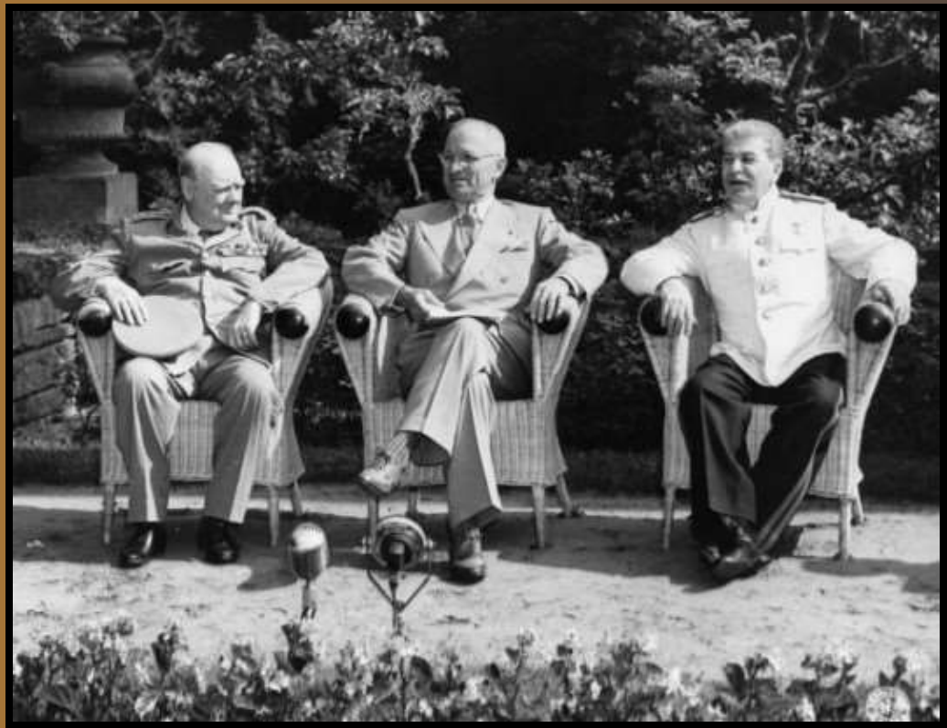
W.Churchillis, H.S.Trumanas ir J.Stalinas

Visiems konferencijos posėdžiams pirmininkavo JAV prezidentas. Jau pačią pirmą dieną buvo numatyta, kad Vokietiją okupuos Sovietų Sąjungos, JAV, Didžiosios Britanijos ir Prancūzijos kariuomenės, o jų vadai sudarys atskirą administraciją, kuri demilitarizuos, denacifikuos, decentralizuos ir demokratizuos Vokietiją.