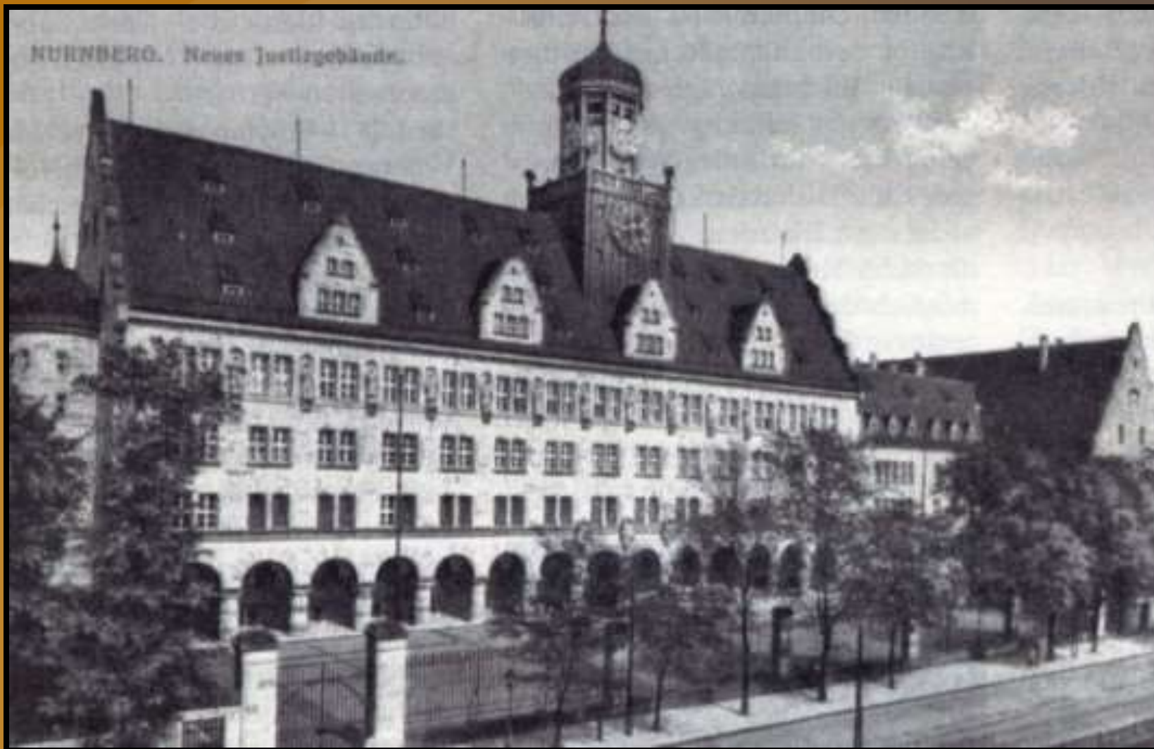
Teismo posēdzīams rengti parinkti Niurnbergo teisingumo rūmai.