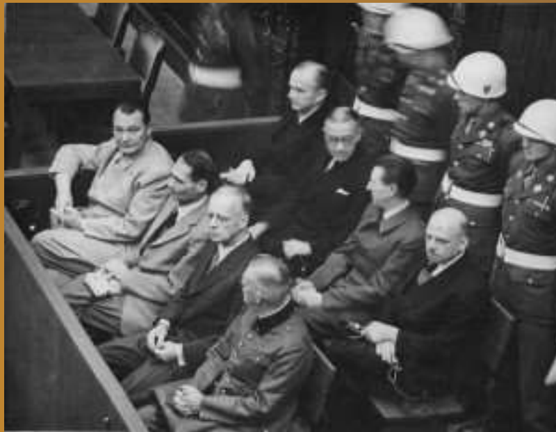
Niurnbergo proceso teisiamieji

1946 m. rugsėjo 30–spalio 1 d. buvo paskelbti nuosprendžiai. 11 kaltinamųjų nuteisti mirties bausme pakariant, trys – kalėti iki gyvos galvos, keturi – kalėti įvairų laiką, trys išteisinti.