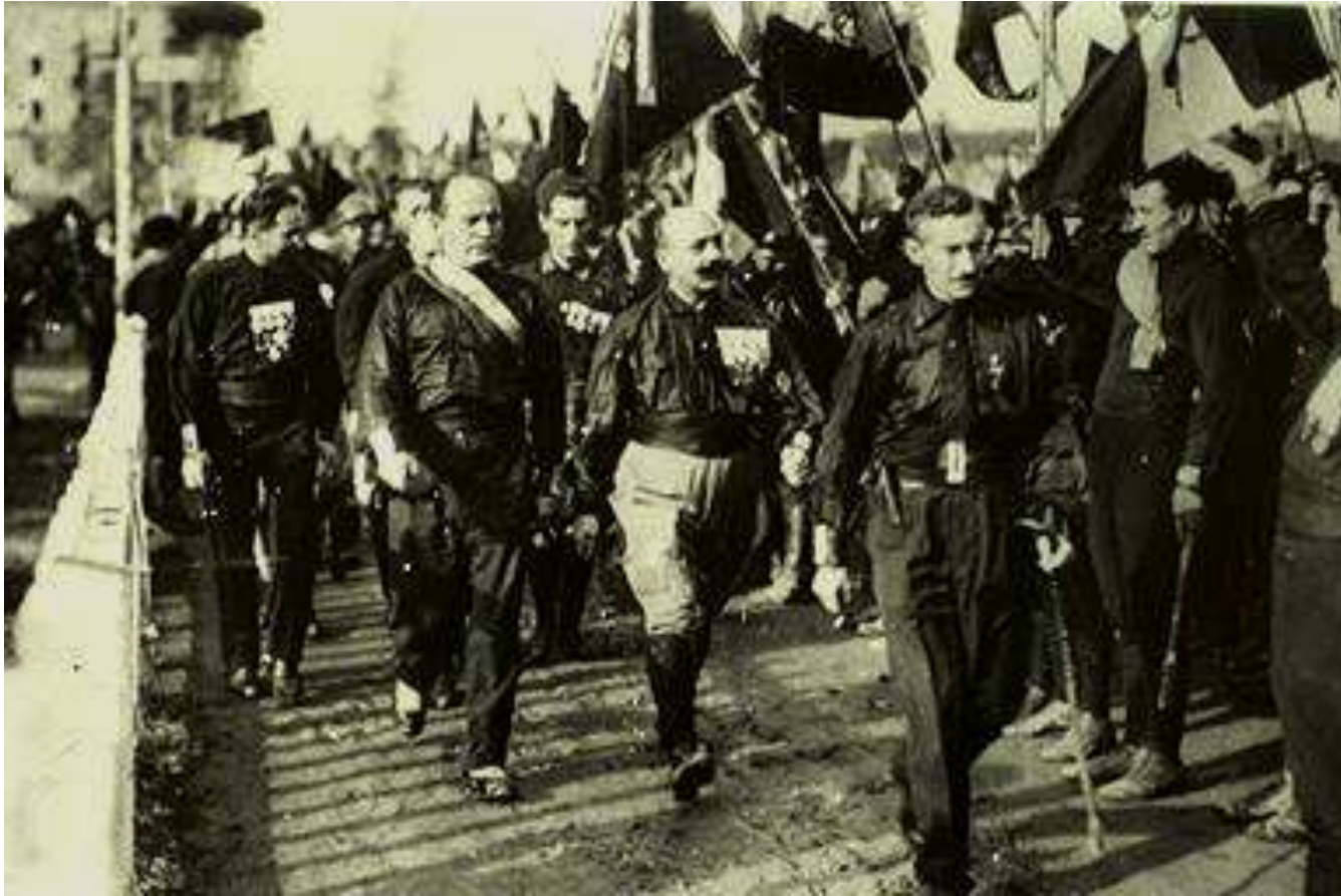
Benito Mussolinis ir juodmarškiniai fašistai 1920 m.