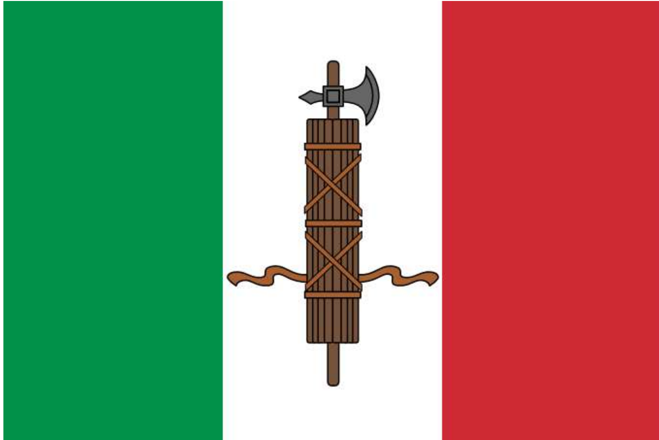
Italijos fašistų partijos vėliava