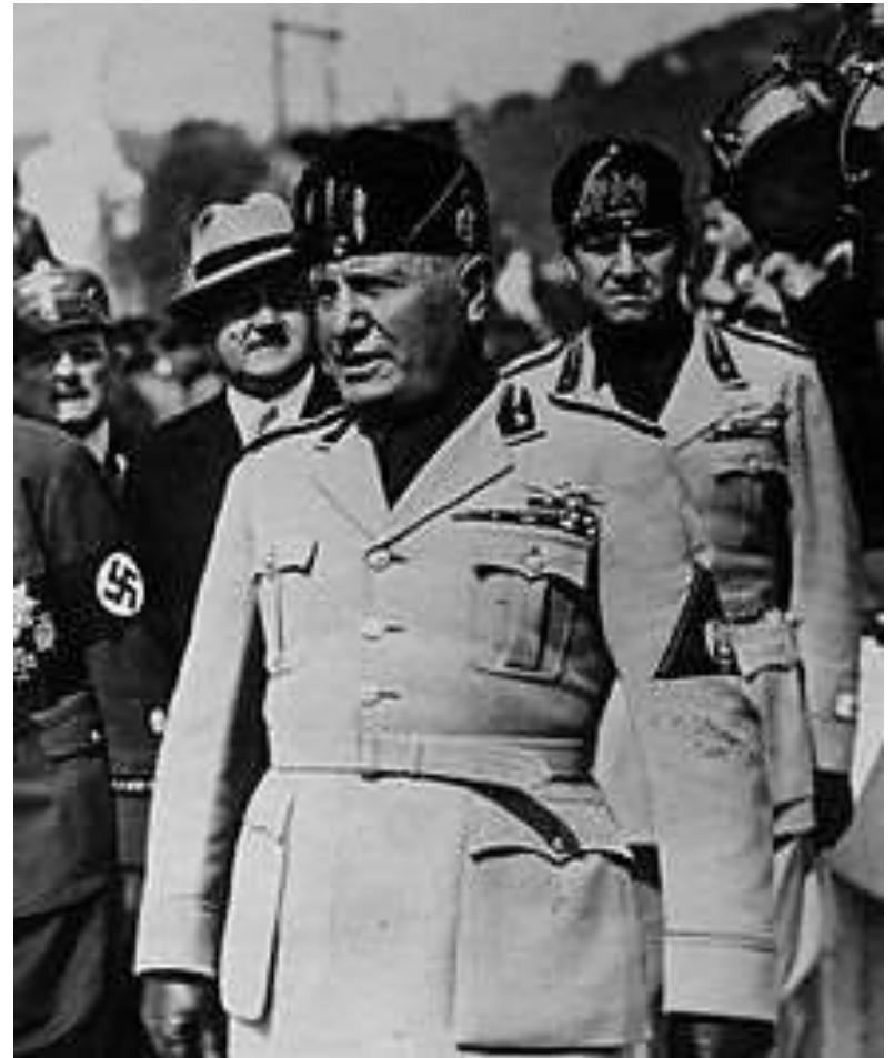
Benitas Musolinis (1883 – 1945 m.)