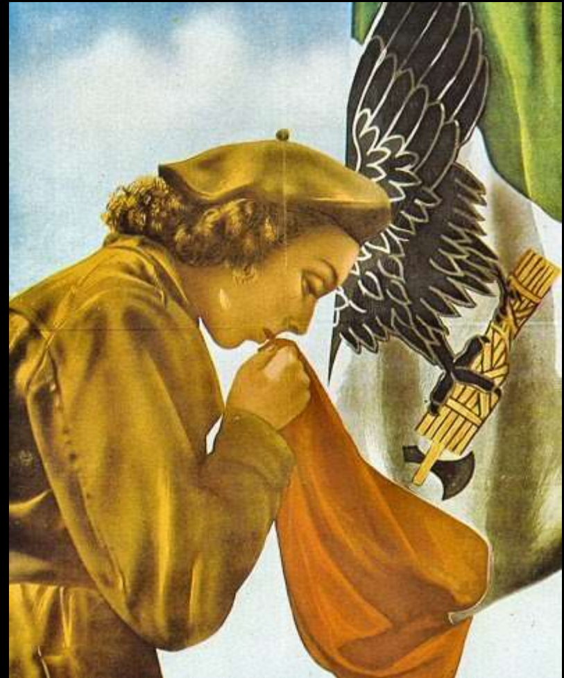
Jaunoji fašistė rodo pagarbą Italijos vėliavai