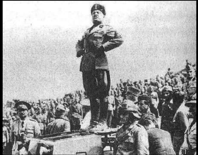
Žygis į Romą

Tada daug kam atrodė, kad fašistai išves šalį iš krizės, sustabdys kylančią revoliuciją. Karalius Viktoras Emanuelis III 1922.10.29 d. Pranešė Musoliniui, kad jam pavedama suformuoti vyriausybę.