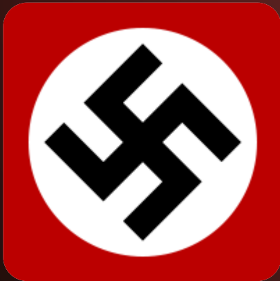
svastika – nacių simbolis