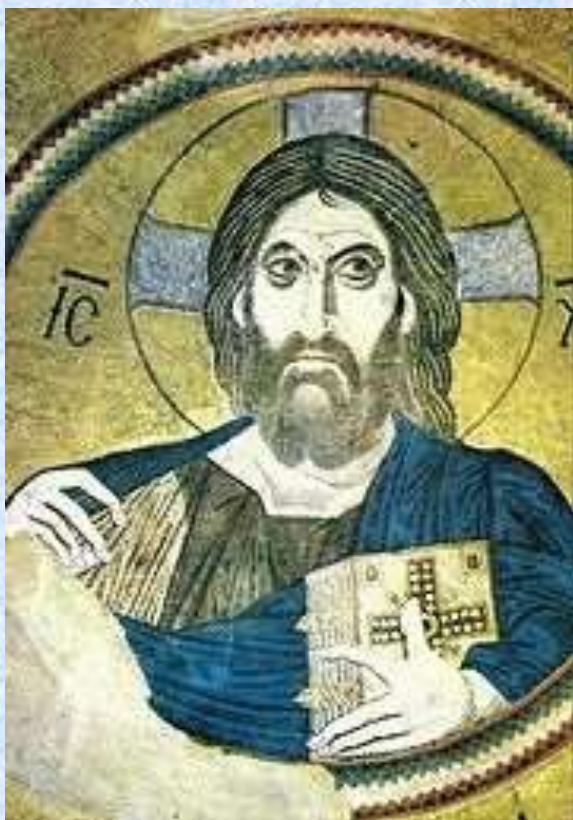
Jėzus Kristus XIa. portrete

Tikintieji nebuvo sukilėliai. Jie gerbė imperatorių, pripažino jį krašto valdovu, pakluso jo įsakymams, bet atsisakydavo garbinti jį kaip dievą. Yra išlikę daug užrašytų pasakojimų apie tai, kaip žmonės, ilgiau bendravę su krikščionimis, įsitikindavo romėnų valdžios kaltinimų neteisingumu, pamildavo juos ir patys atsiversdavo, įtikėdami Jėzų Kristų.