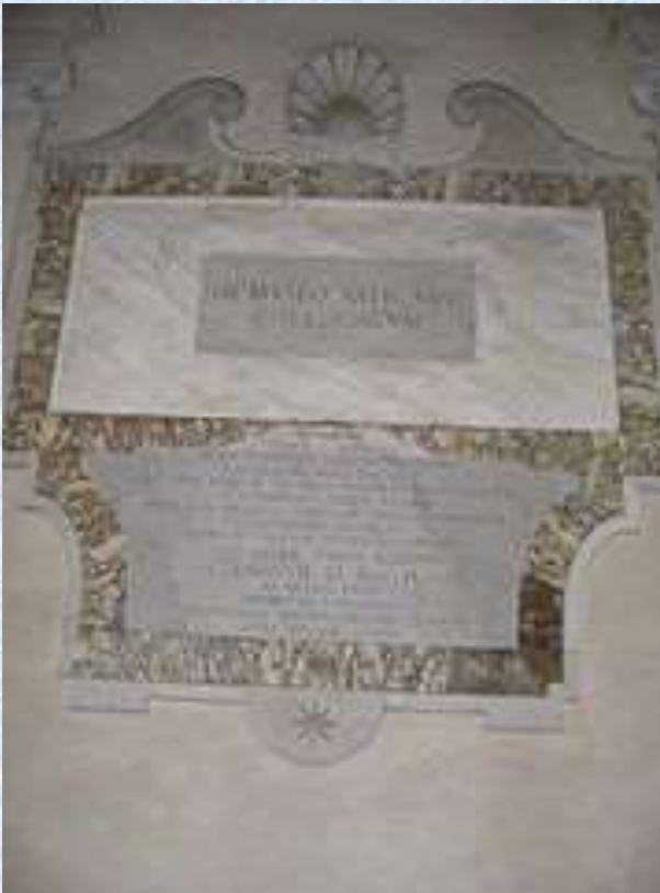
Romos katakombos sienos fragmentas

Kristaus mokiniai buvo deginami, kryžiuojami, užmėtomi akmenimis. Bėgdami nuo persekiojimų, krikščionys ištisomis bendruomenėmis pradėjo slėptis olose ir katakombose. Iki šių dienų yra išlikę virš 4000 krikščioniškų raižinių požeminėse galerijose, esančiose po Romos miestu.