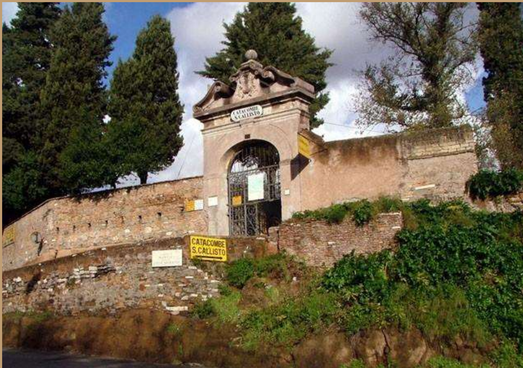
Šv. Kaliksto katakombos