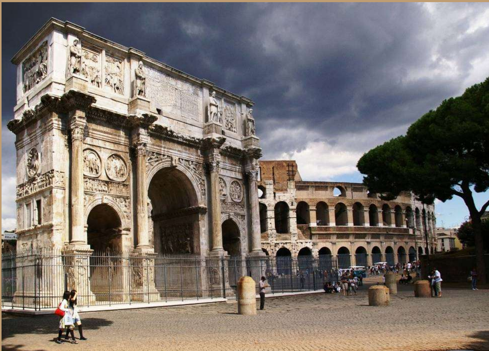
Konstantino Triumfo arka Romoje - architektūrinis paminklas, skirtas pažymėti karvedžio pergalei.