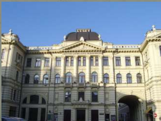
Dabartinė Vilniaus filharmonija, kurioje vyko 1905 m. suvažiavimas