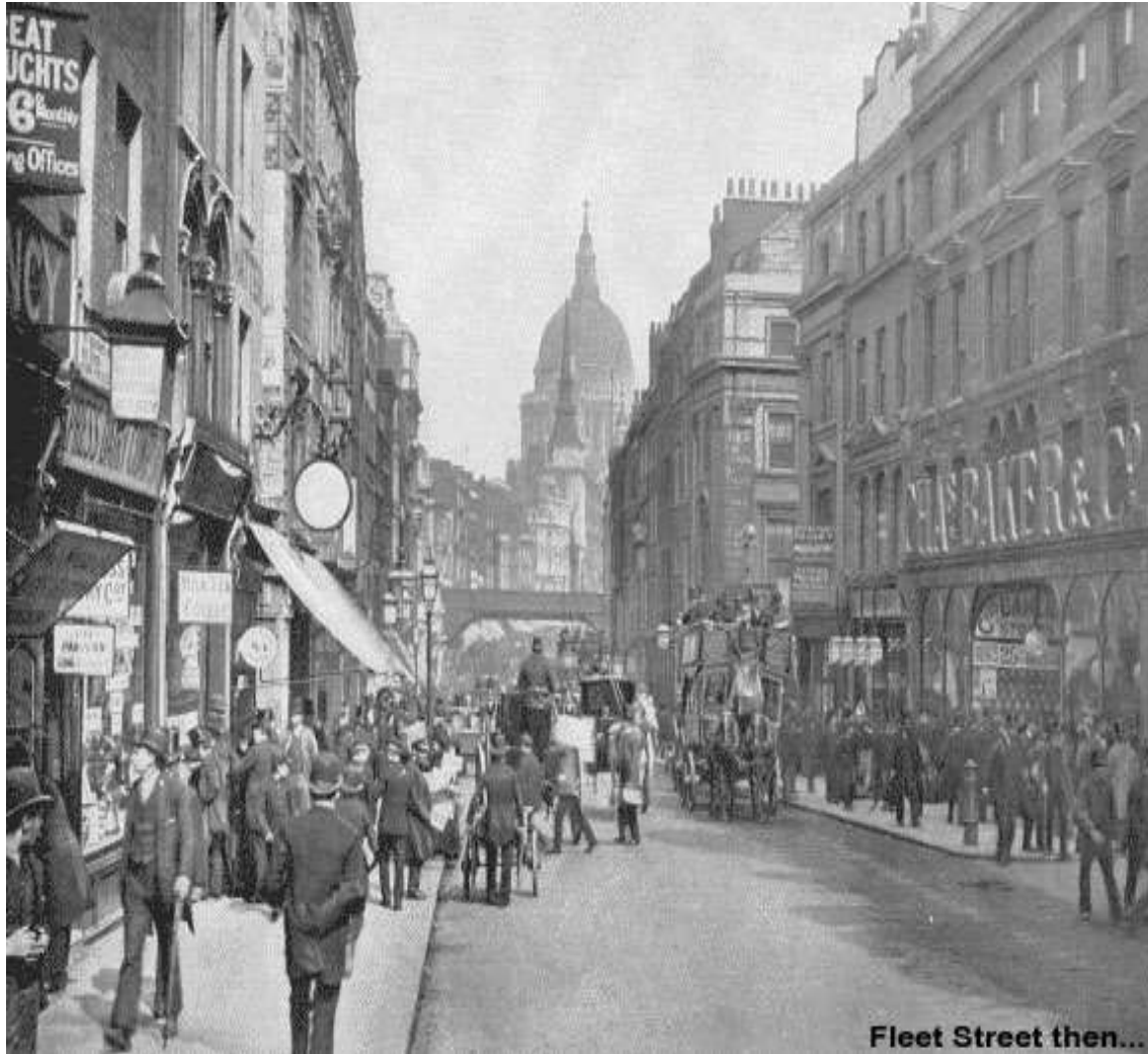
Fleet Street then...